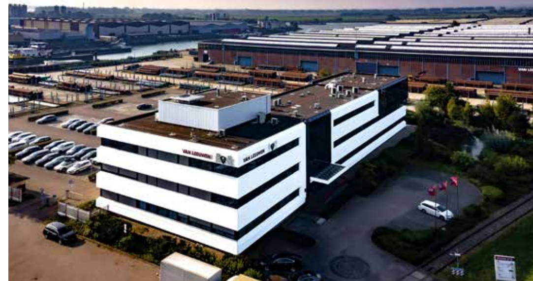
Kantoor en magazijnen van Van Leeuwen Buizen in Zwijndrecht.

roer. Makkenze: "En ook de vierde generatie is inmiddels aan boord. Wij leveren hoofdzakelijk koolstofstalen buizen en duplex en superduplex roestvrijstalen buizen. Behalve aan de staalconstructie markt en infrastructuur leveren we ook aan de olie- en gasmarkt, de werktuigbouw, transportmiddelenindustrie en de automotieve branche. Kortom; we leveren wereldwijd en voor uiteenlopende toepassingen."