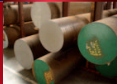
Assenstaal, tot 1000 mm diameter

Dit hoogwaardige product wordt voornamelijk gebruikt voor de vervaardiging van tandwielen in industriële toepassingen.